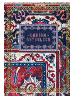
Cabana anthology. Portada de Cabana Anthology (Vendome Press), una recopilación de imágenes y entrevistas representativas del universo Cabana .

Está siendo un año muy difícil para todos, pero en cambio el e-commerce ha ido muy bien. La tienda online es una combinación entre objetos producidos por nosotros, piezas vintage que encontramos y vendemos y nuestras colaboraciones con creadores. Lo más apasionante es descubrir artesanos en cualquier lugar del mundo y proponerles crear algo para nosotros. Ahora acabamos de lanzar una colección de tejidos junto a Peter d'Ascoli, y estamos ultimando otras colecciones con Schumacher y con Rianna + Nina, que saldrán al mercado muy pronto. T