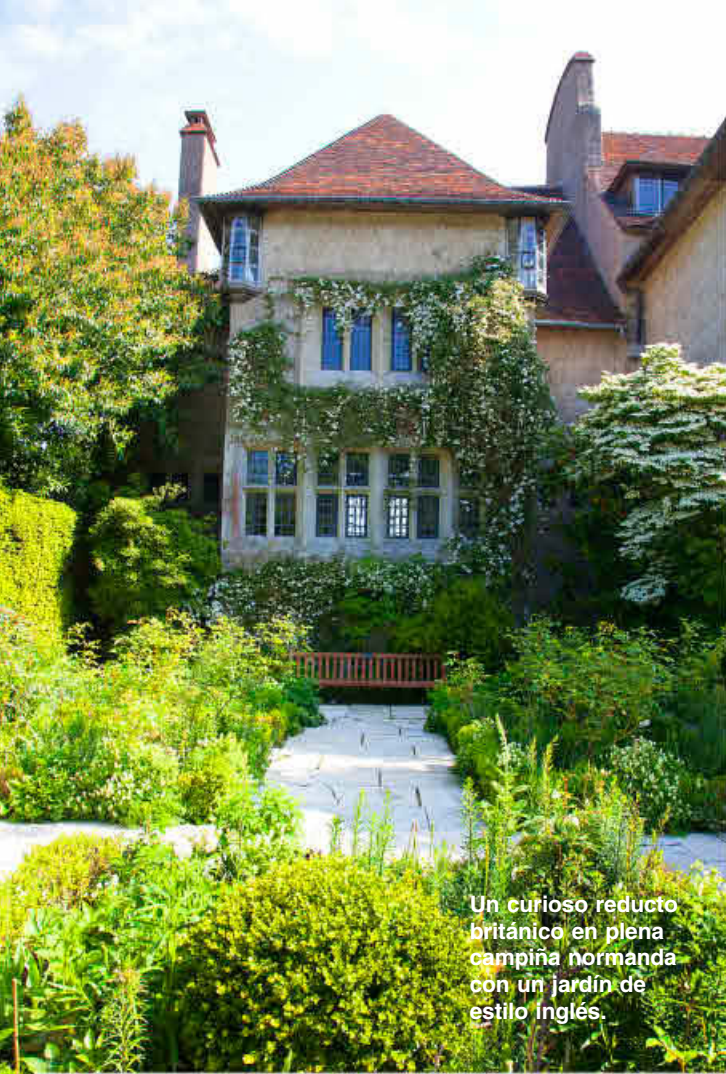
Un curioso reducto británico en plena campiña normanda con un jardín de estilo inglés.