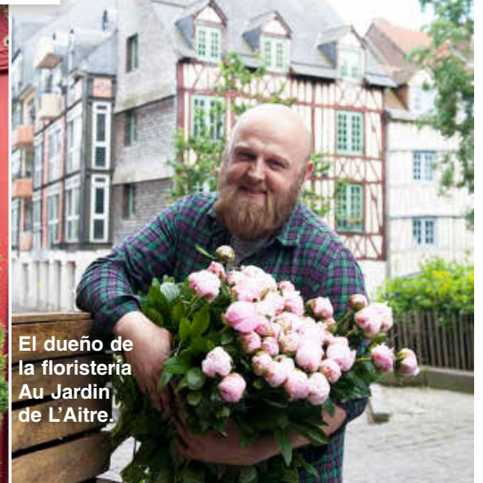
El dueño de la floristería Au Jardin de L'Aître