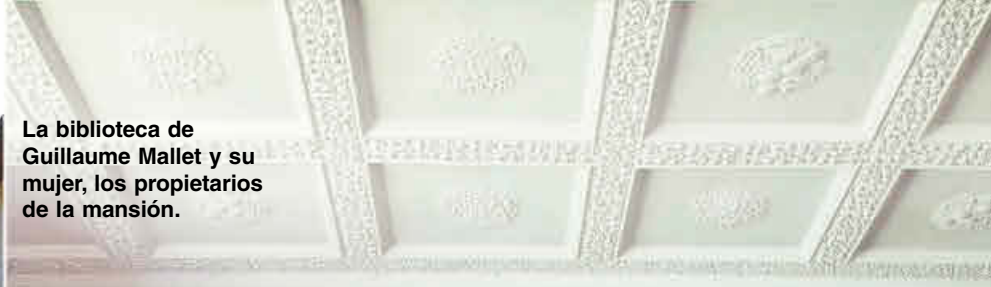
La biblioteca de Guillaume Mallet y su mujer, los propietarios de la mansión.