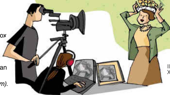
Ilustración: XIMENA MAIER

● VisitWiltshire: ( www.visitwiltshire.co.uk )