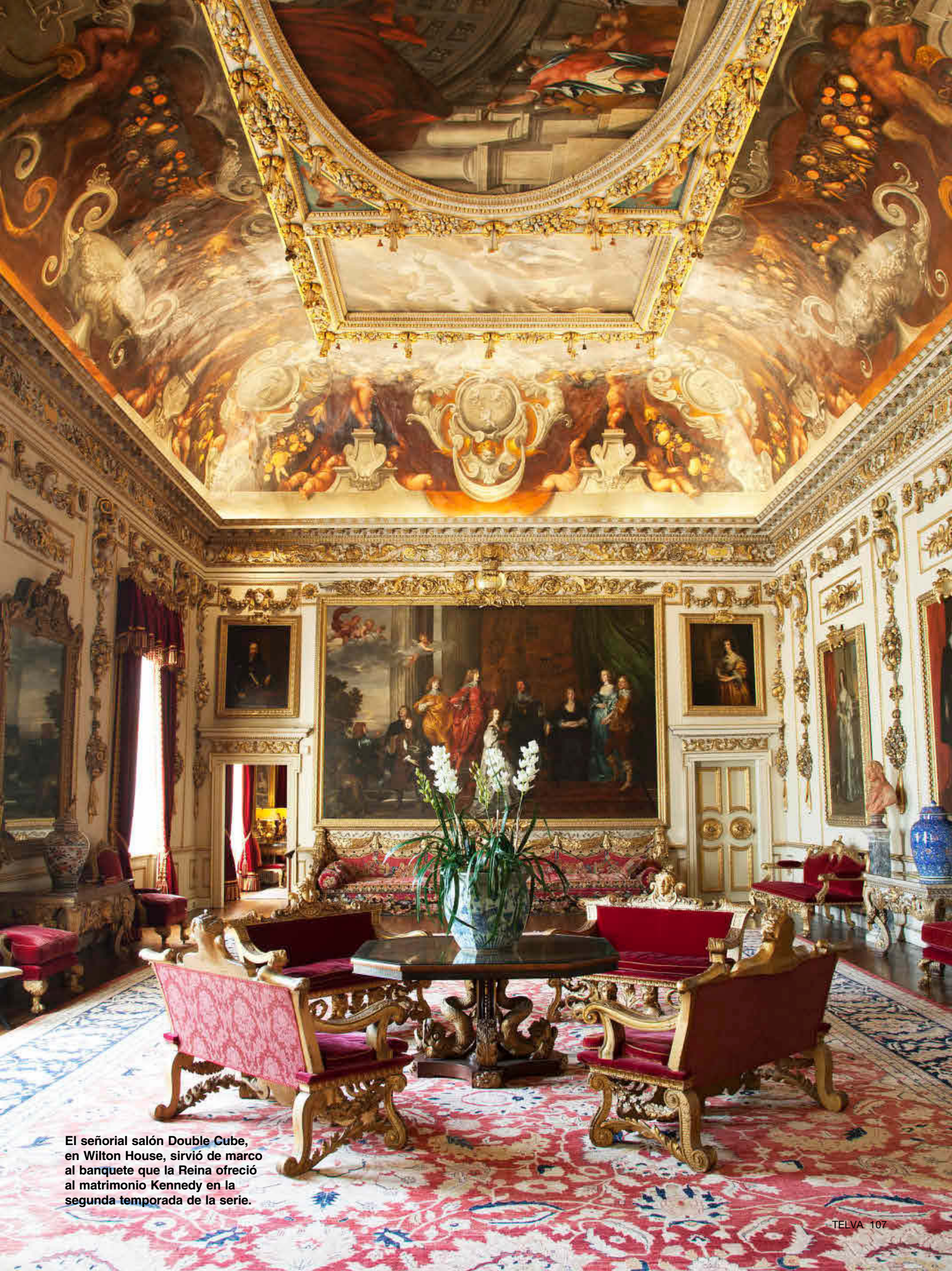
El señorial salón Double Cube, en Wilton House, sirvió de marco al banquete que la Reina ofreció al matrimonio Kennedy en la segunda temporada de la serie.