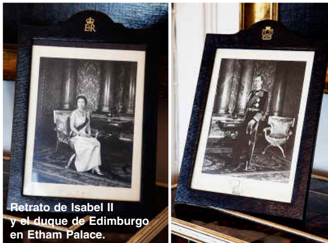
Retrato de Isabel II y el duque de Edimburgo en Etham Palace.

Junto a este magnífico salón hay un pequeño despacho en el que, durante ese mismo episodio, la reina y Jackie se reúnen a solas para compartir confidencias después del banquete. A su lado se acondicionó una zona de trabajo para rodar una de las escenas con mayor carga dramática de la serie. La reina está sentada