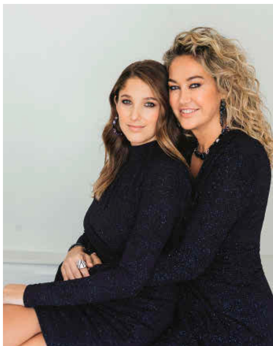
Madre e hija con distintos looks del mismo tejido glitter azul noche. Todo, Lola Casademunt.

(Maquillaje y peluquería: Lu Romero para The Artist Talents (Keka) con productos ICON. Agradecimientos: The Cover y Hotel Sir Victor).