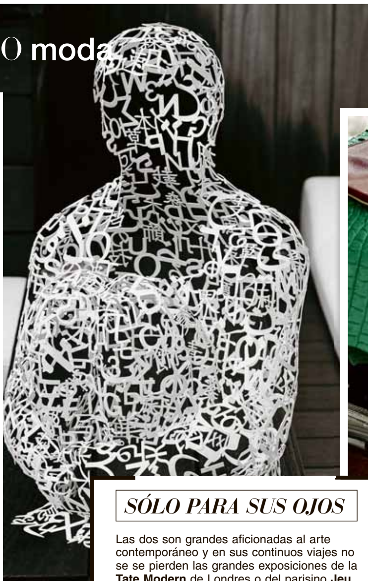
Escultura de Jaume Plensa, uno de los artistas preferidos de Eva. Abajo, retales de piel sobre colección de libros de arte, moda y decoración.

El salón de Eva, donde nos sentamos a charlar, es un reflejo fiel de su manera de ser: intensa, apasionada y algo caótica. Es un amplio cuadrilátero acristalado con sofás y un potente equipo de música, presidido por una imponente foto de Karl Lagerfeld que convive con una escultura de Jaume Plensa y un cuadro de Jesús de Villalonga. En las estanterías, fotos de su familia y amigos mezcladas con sombreros, collares, maquetas, libros de arte, montañas de re-